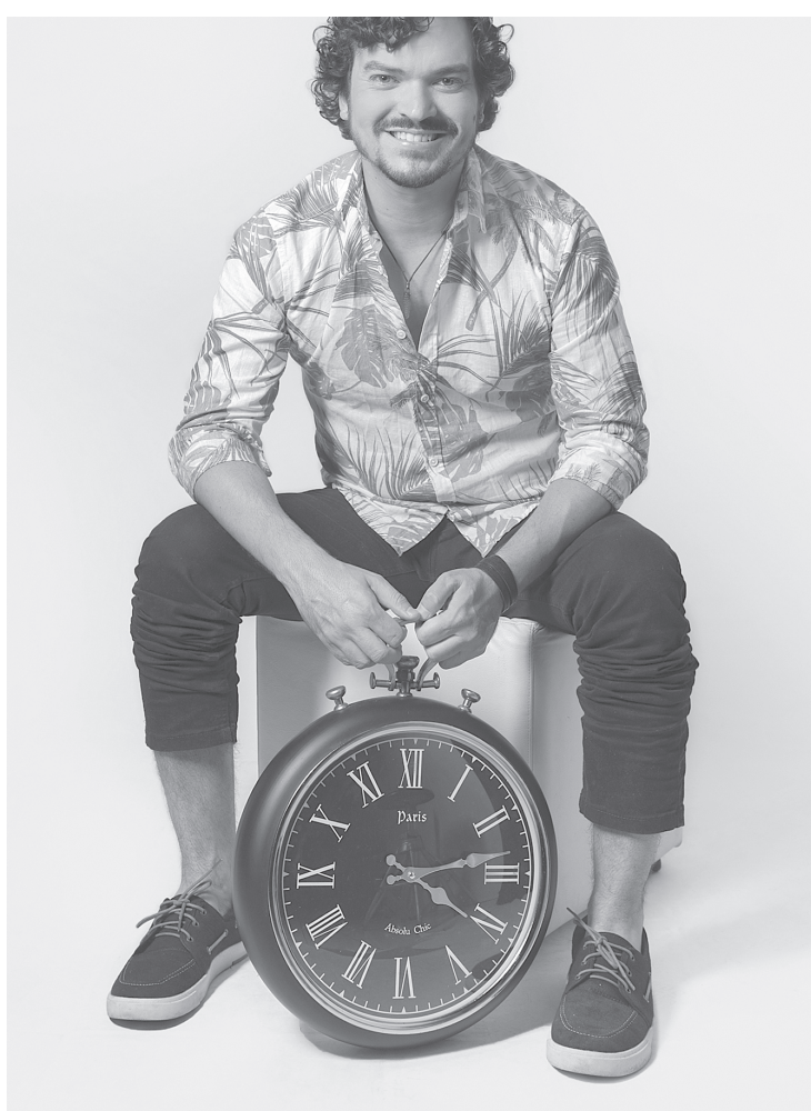
Marco Túlio na contagem regressiva para lançar seu single 'Conto Os Ais'