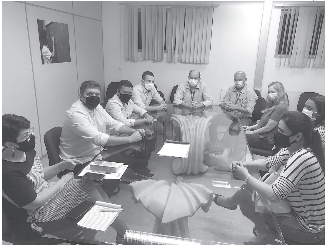
Vereadores de Volta Redonda e Barra Mansa se unem para pedir EJA na Região Leste de Barra Mansa