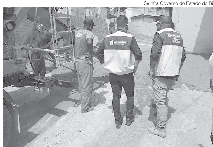
Obras são feitas em parceria com os municípios